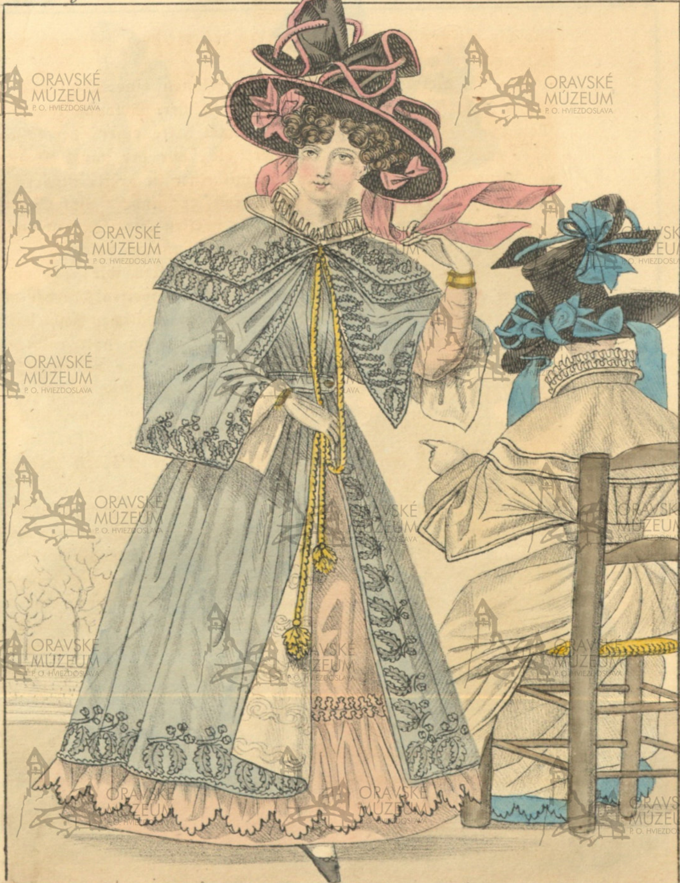
Hut von Sammet mit Bandern. Mantel von brodirtem Cachemire-Tuch, mit Moiré gefuttert u. mit Kragen u. dermel-draperie versehen.